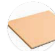
Refrattario 2° piano

...altri accessori disponibili a pag. 70 ...view more accessories at pg. 70