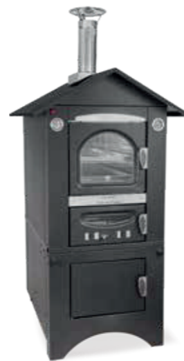
Smart Tetto antracite Charcoal grey roof